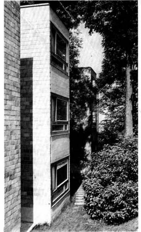
5 Die Bauten sind um einen zentralen Kinderspielplatz gruppiert. Les bâtiments sont groupés autour d'une place de jeux centrale. The buildings are grouped round a central playground.